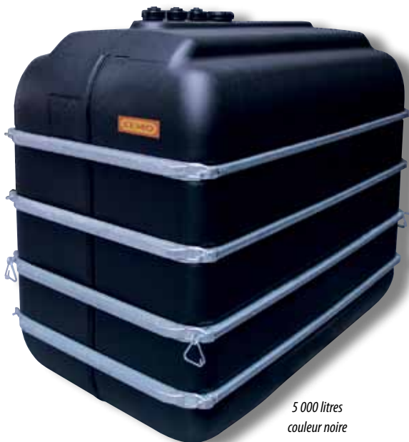
5 000 litres couleur noir