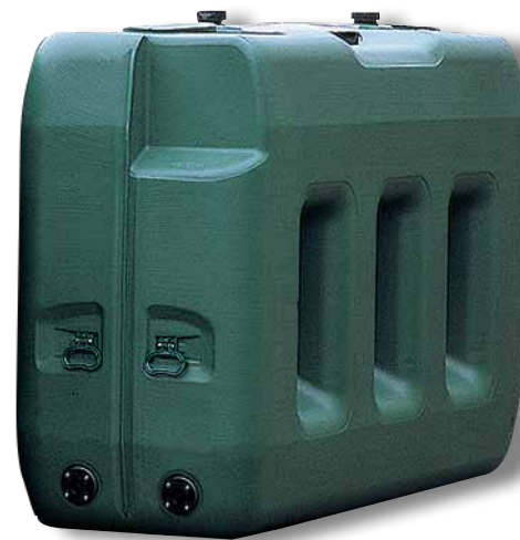
3 000 litres