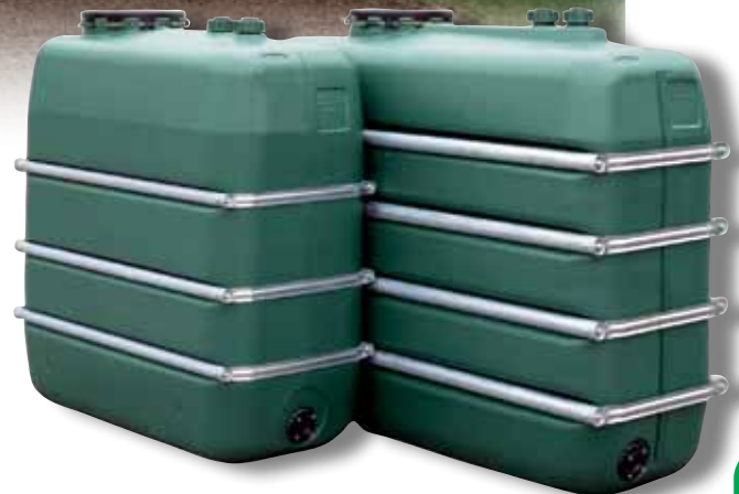
1 500 et 2 000 litres