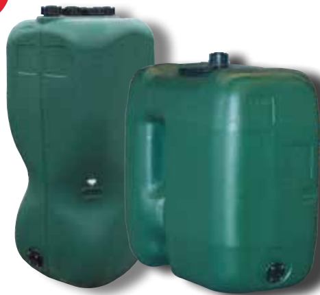
750 litres et 1000 litres