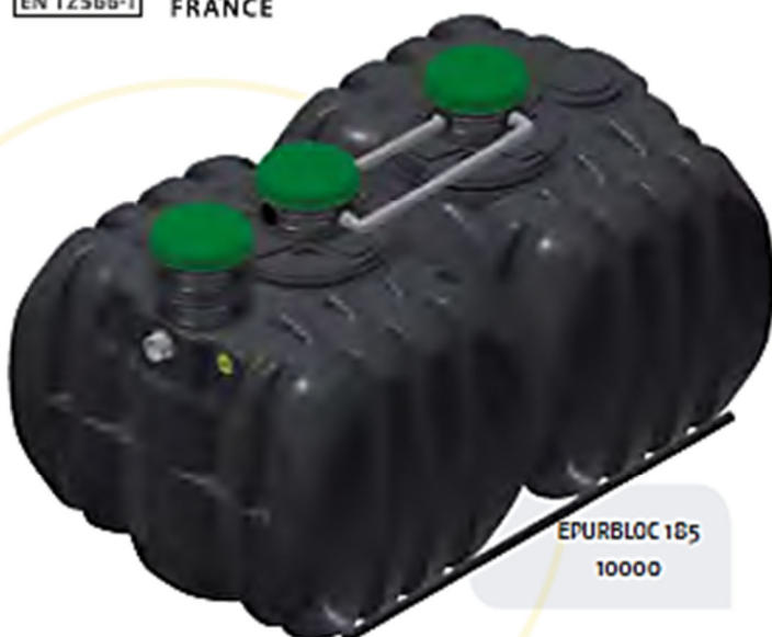
EPURBLOC 185 10000

Nos fosses septiques toutes eaux à nervures sont disponibles en gamme QR de 4000 à 25 000 litres. Elles sont adaptées pour recueillir toutes les eaux usées domestiques, dans le cadre d'une installation neuve ou d'une mise en conformité de l'assainissement.