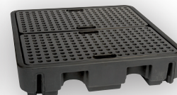
Bac DRUM 240/4