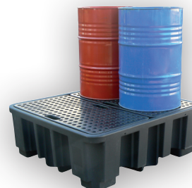
Bac DRUM 450/4