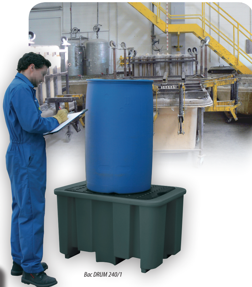
Bac DRUM 240/1