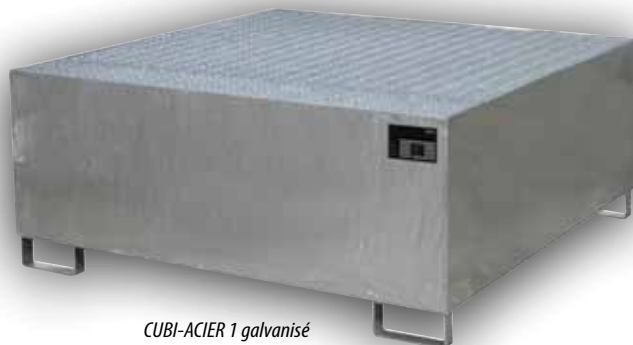
CUBI-ACIER 1 galvanisé